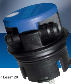
Пробка Water Less® 20

Увеличенное время эксплуатации батареи – Более продолжительные периоды между доливами воды